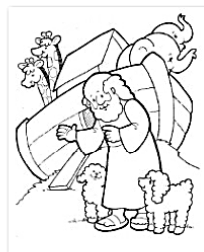
arca de Noé