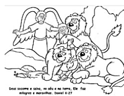
Daniel cova dos leões